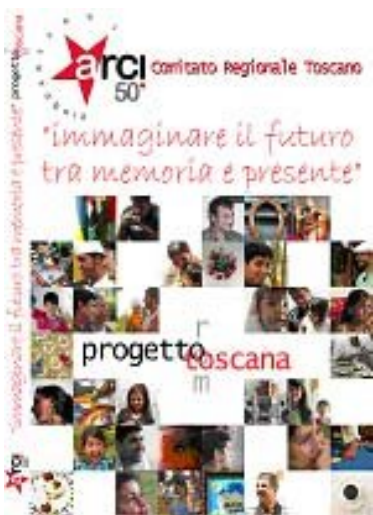
DVD Progetto Rom

Le famiglie sono state da subito accompagnate da operatori qualificati in un rapporto di progettualità che