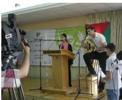
I ragazzi introducono la conferenza

La missione in Palestina si è svolta dal 26 agosto al primo settembre. I tre giorni della conferenza a Betlemme sono stati dedicati al ruolo del bambino nei media