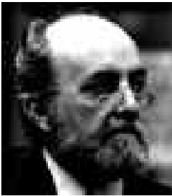
Giulio Maccacaro

Ma, per un altro, lo sentivo come un luogo di eventi strani e tenebrosi, tra i quali un bambino non potesse avventurarsi da solo. La sua cinto e il suo ingresso